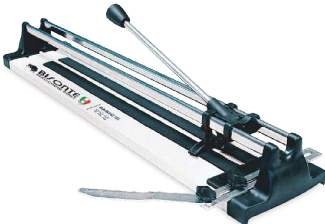
OPTIONAL: Rotiță tăiere