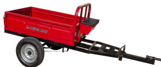
Remorcă 400 kg sau 500 kg