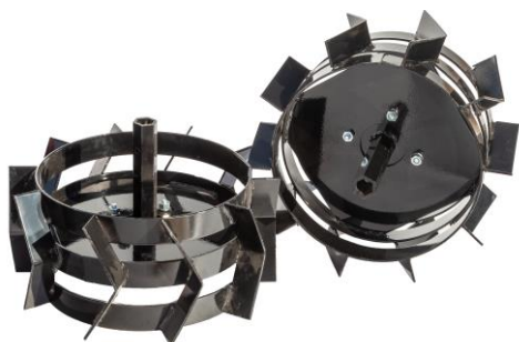
Set roți metalice 350 mm sau 400 mm cu adaptoare de fixare