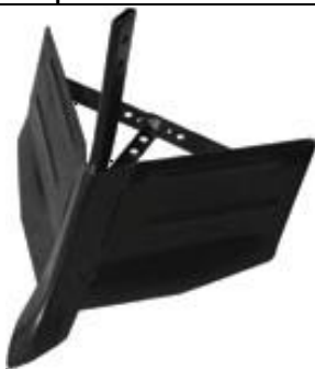
Accesoriu deschis rigole reglabil