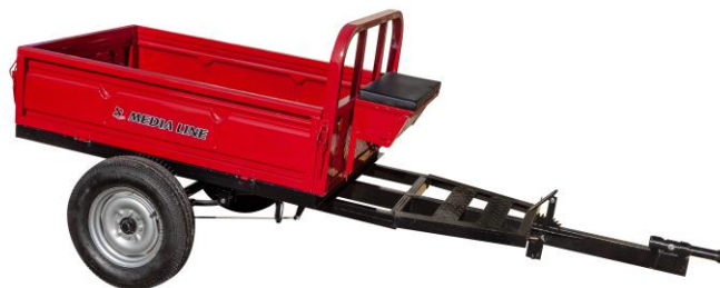
Remorcă 400 kg sau 500 kg